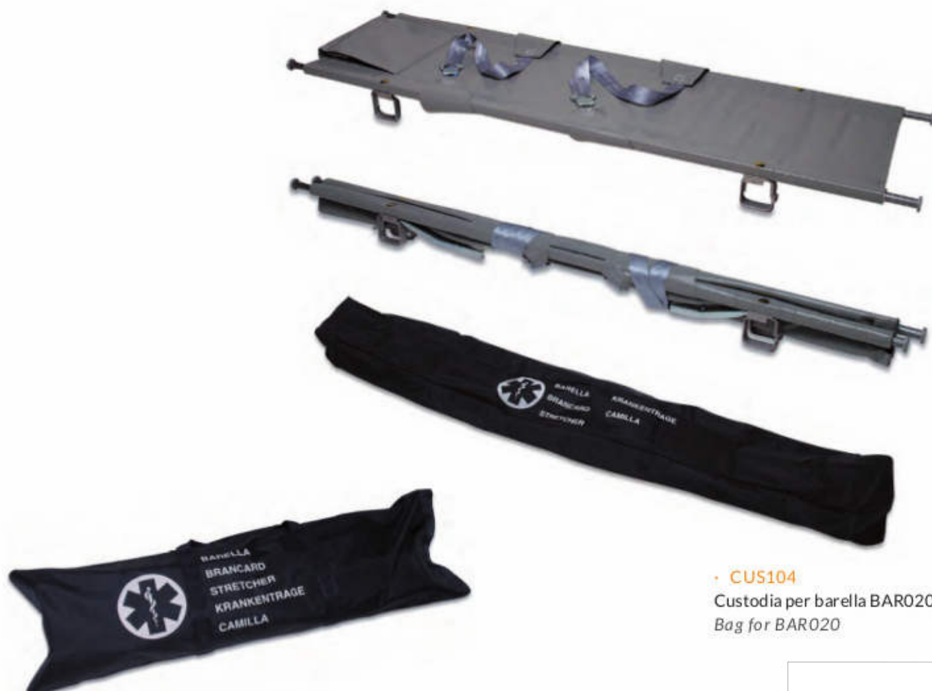
• CUS104 Custodia per barella BAR020 Bag for BAR020

Stretchers produced in siliconised aluminium, anticorrosion, feet arranged to be hooked to the ambulance internal rail, extractible handles, fire retardant and anty-putrefaction cot with cushion bag. With two fixation belts with quick release buckle. Guaranteed load kg. 120.