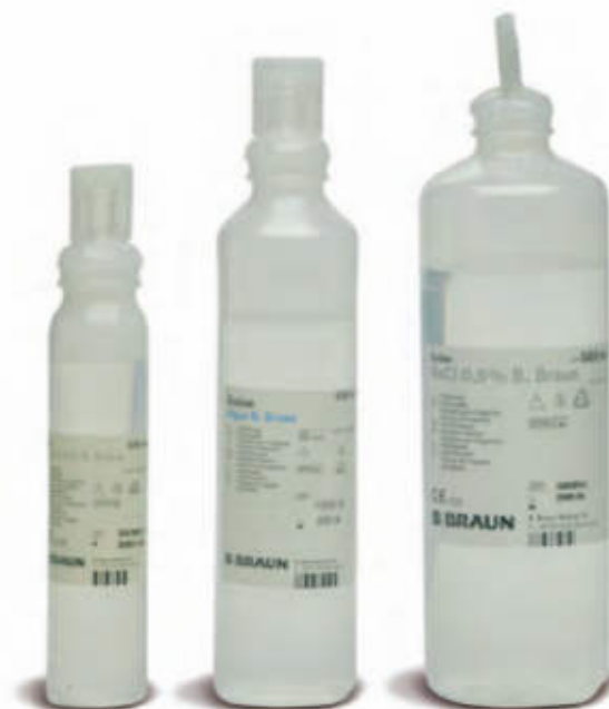
• SOL007 • SOL002 • SOL004

SOL007 100 ml SOL002 250 ml SOL004 500 ml