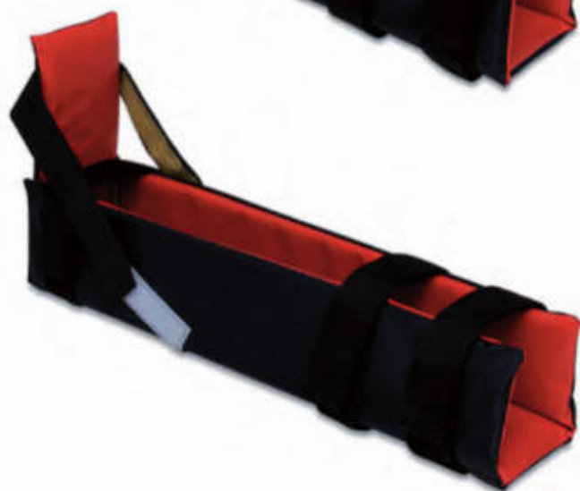
• STE120/P Piccola Small