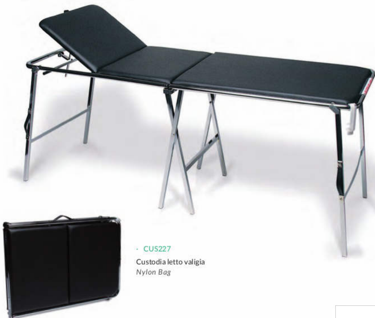
· CUS227 Custodia letto valigia Nylon Bag

Made out of white metal tubes, washable vinyl padded, adjustable head rest. Very practical for massage, physiotherapy, sportclubs, etc. Can be supplied in a nylon bag.