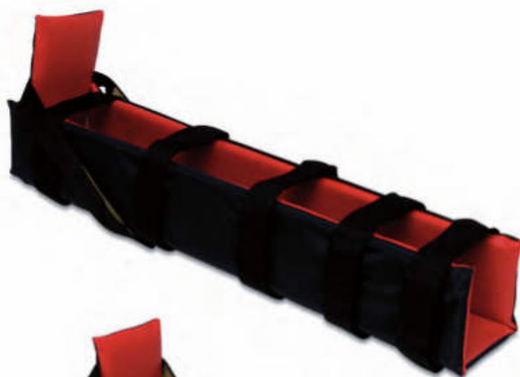
• STE120/G Grande Large

Rigid splints with Velcro strap easy to use for legs and arms washable and X rays translucent.