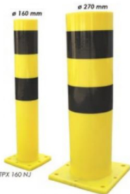
TPX 160 NJ