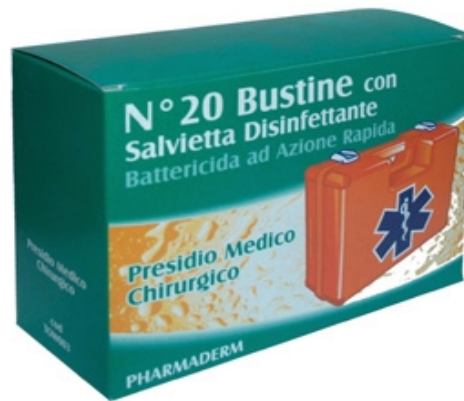
TOW003: conf. da 20 salviette