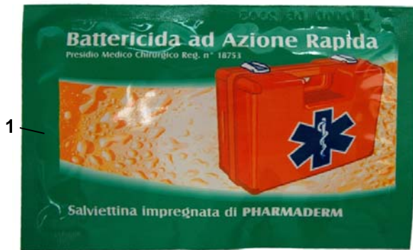
TOW223: salvietta singola