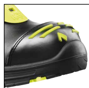
HAIX® High Durability Cap System