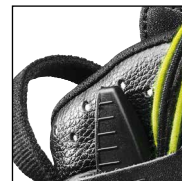
HAIX® Climate System